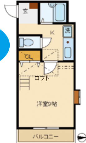
Bタイプ (+ロフト) 1K 専有面積:26.36㎡