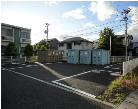
トランクルーム(倉庫)としてのご利用例