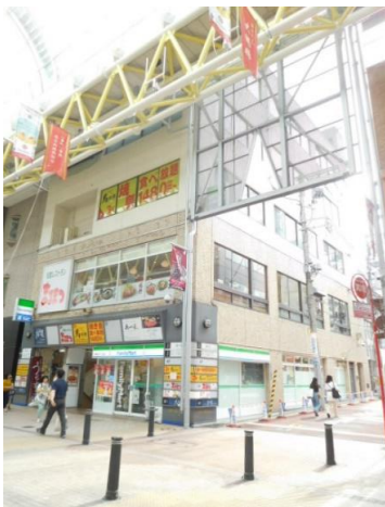
美容室も可能な4階店舗！