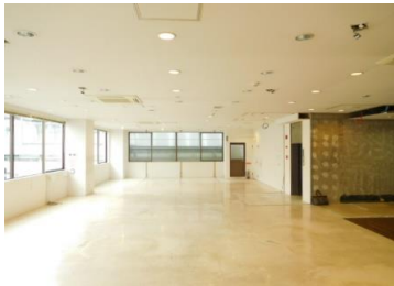
↑ 内観 ぶらんどーむ一番町 ↓