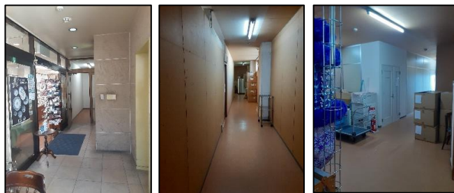
↑A 4階店舗前 ↑B 4階現通路 ↑C 4階現倉庫前