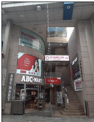
↑人気の仙台駅前エリア！