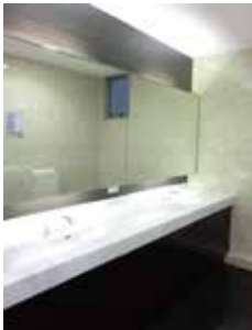
セコムセキュリティが完備されたWC セコムセキュリティでカードをタッチし入室します。