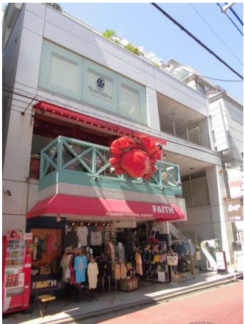
エレベーター有り！