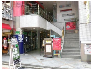
↑ エントランス 看板スペース ↓