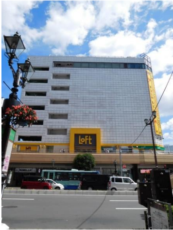
↑2階～ロフトさんのあるビルです！