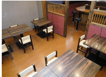
↑ (内観) テーブル席 (内観) カウンター席 ↓