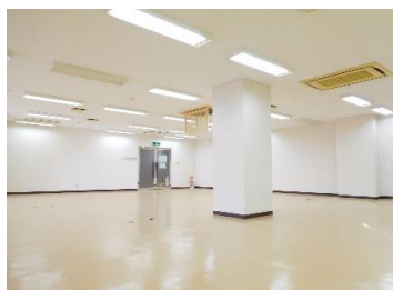
↑ 201-A 内観 202 内観 ↓