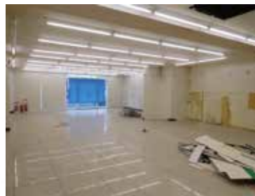
※1F 既存テナント退去直後撮影 ※引渡し状態: 応相談

東北大学病院が目の前にあり、マンション3~5階は住居。 北山トンネルを通り、中心部に向かう方の道路沿いに立地し、通行量も多い場所の1階路面店です。