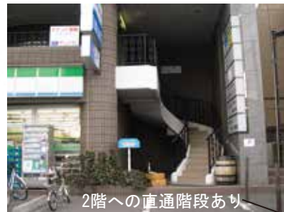
2階への直通階段あり