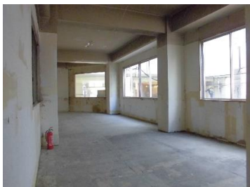
↑ 内観（※スケルトン時の写真となります）