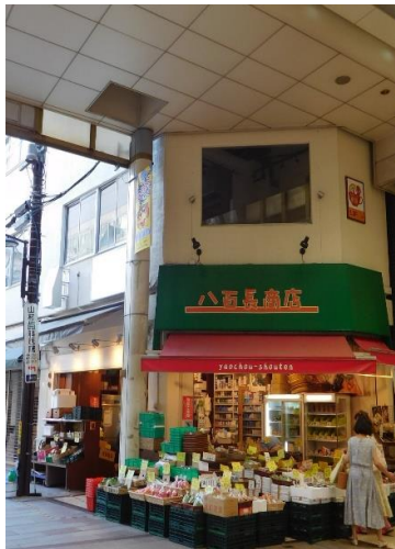
お店をアピールできる 2階専用看板スペース有！

マールロード大町アーケードに面する角地！ アーケードからの視認性良好・看板スペース多！