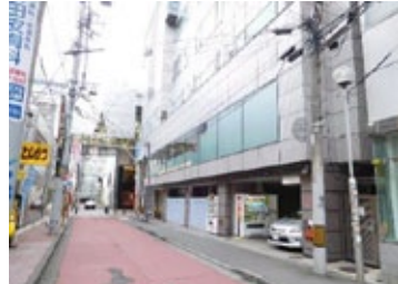
↑ 郵便局側 有料看板 ↓